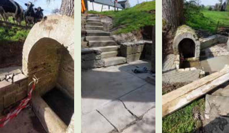
Réfection de la rampe de la rue du Tienne à Natoye