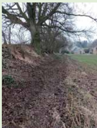
Remise en état du sentier communal rue des Richots et rue de Francesse (Natoye)