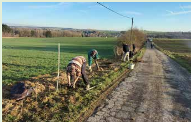
Mise en place de plantations le long de la rue du Moinil à Hamois par le Groupe Citoyens Sentier de Hamois.