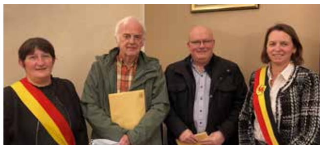
Les 2 nouveaux conseillers de l'Action sociale entourés de la Bourgmestre et de la Présidente du CPAS à l'occasion de leur prestation de serment le 3 février 2022.