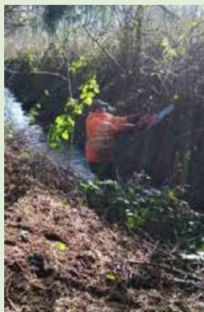
Curage du Saint-Remacle et nettoyage des berges