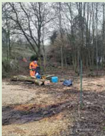
Début du chantier dans le petit bois communal près du parking d'Hubinne à Hamois. Aménagement d'une mare favorisant la biodiversité et mise en place d'un espace de détente.