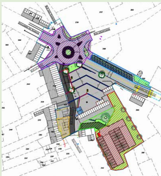
Futur aménagement de la place d'Emptinne

Extension de l'école communale de Natoye, chaussée de Namur 23. Les nouveaux locaux accueilleront des prés et 1 ères maternelles, des classes primaires ainsi qu'une salle polyvalente.