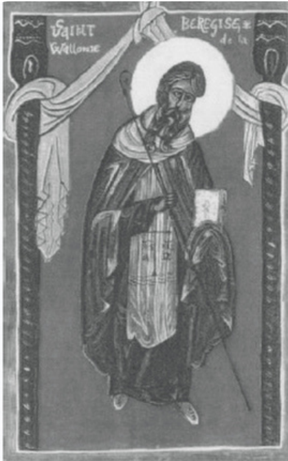
Enluminure de Saint-Bérégise