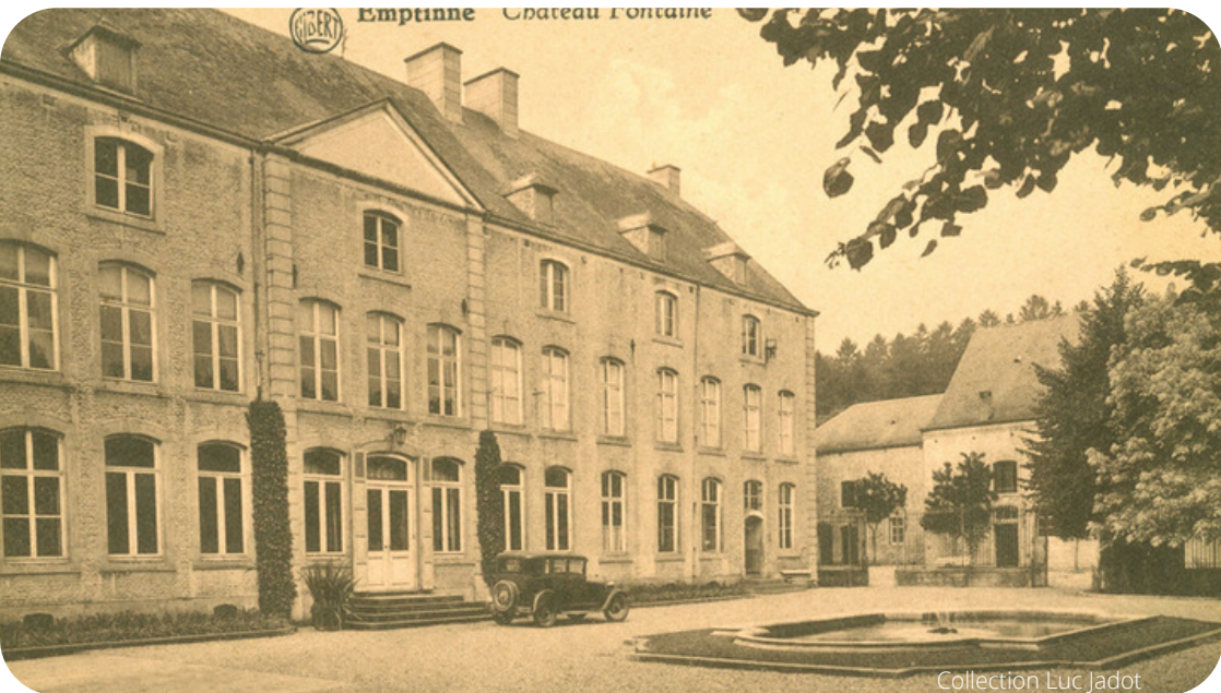
Château Fontaine au début du 20e siècle.