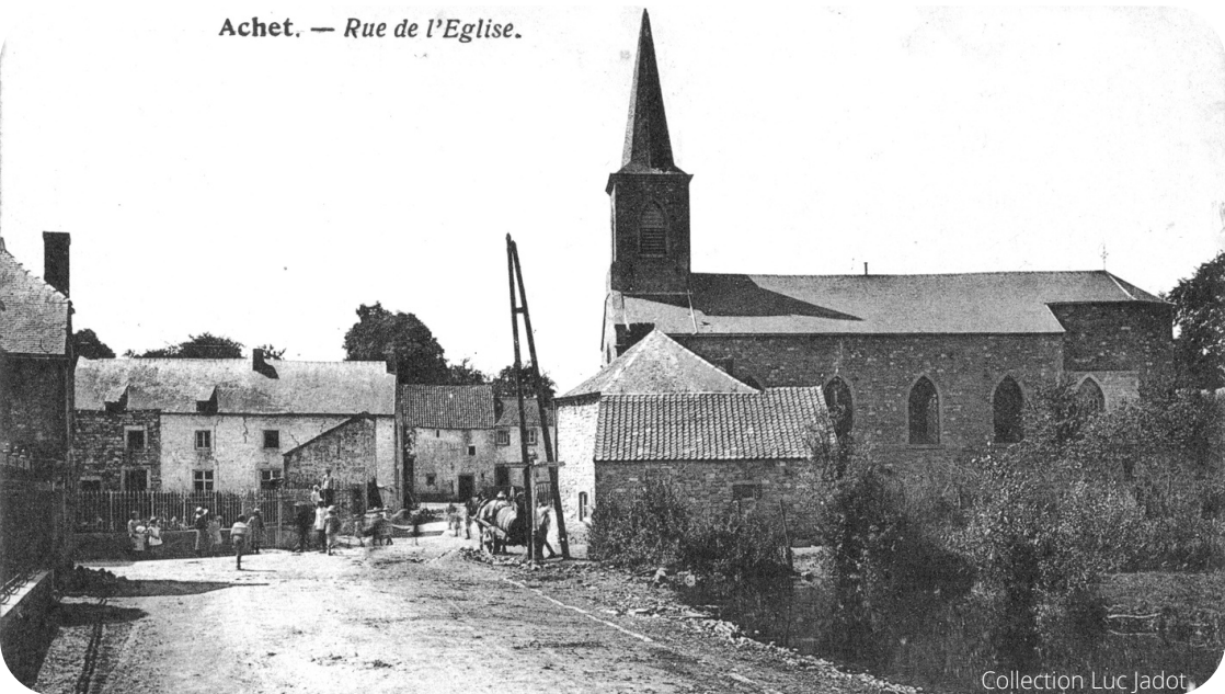
Achet. — Rue de l'Eglise.

Quelques fragments de cette ancienne construction sont intégrés dans la pignon d'une maison voisine.