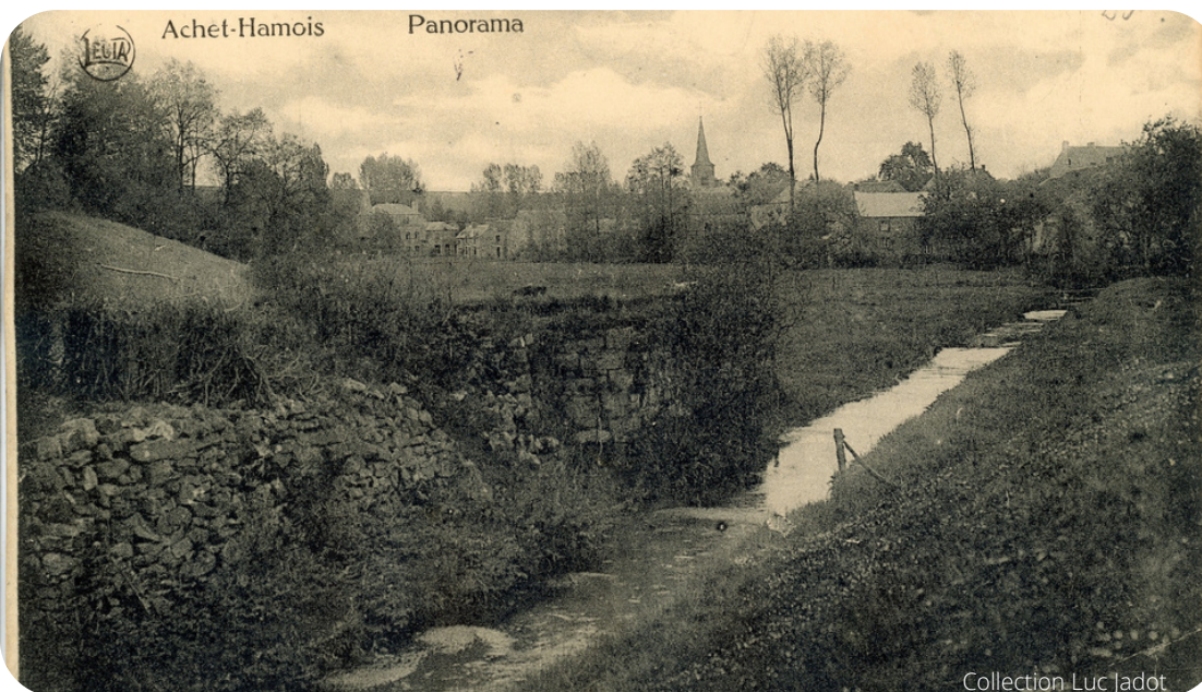
Ruines du Château Tourlouette en 1911.

D'autres murs sont apparus, les uns antérieurs, les autres postérieurs à ces tours. Malheureusement, les matériaux ne livrent guère de renseignements permettant une date précise. Le peu que l'on sait situe ces ruines au Haut Moyen-Âge (fin du 5e - fin du 10e siècle).