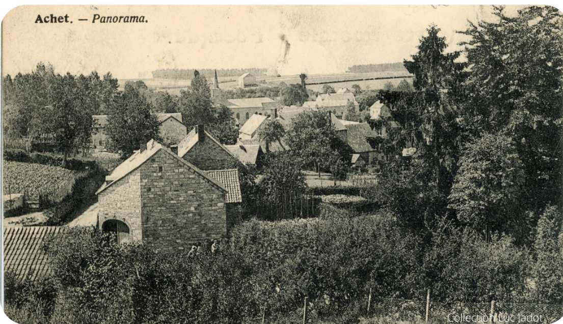
Achet. — Panorama.

Au 10 e siècle, Achet est une possession du chapitre Saint-Paul de Liège et dépend du prince-évêque. Le système féodal va créer alors une multitude de luttes et de conflits. Le conflit le plus sanglant est la guerre de la Vache , provoquée en territoire liégeois par le seigneur de Goesnes (Ohey). On attribue la destruction du château de la Tourlouette à cette guerre.