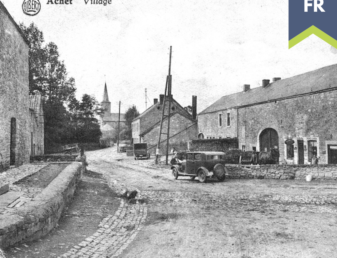
Centre de Achet