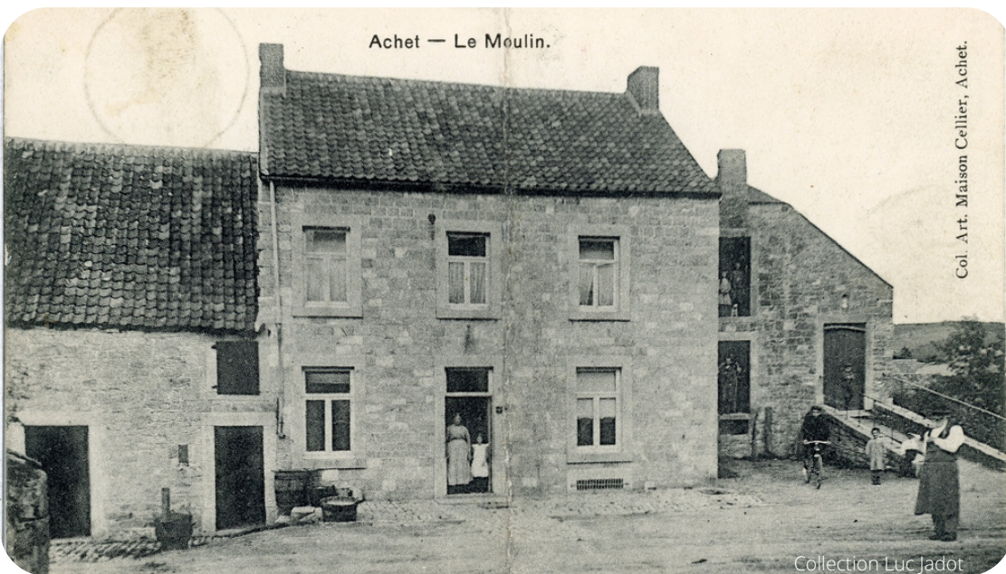
L'ancien moulin de Achet en 1917.