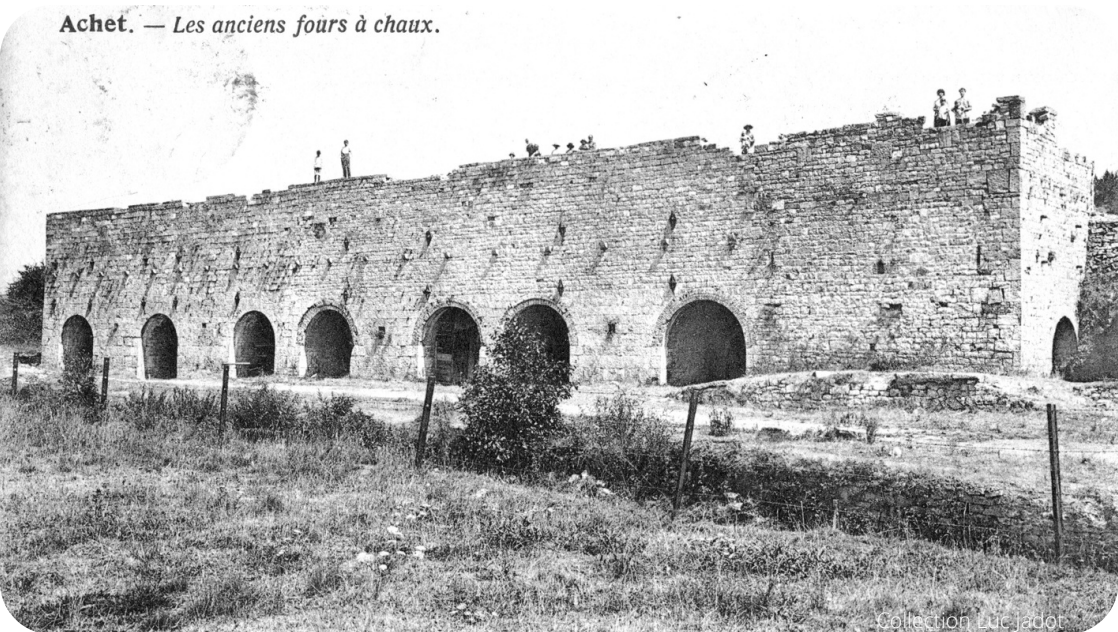
Achet. — Les anciens fours à chaux.

Les fours à chaux cesseront leurs activités vers 1903 .