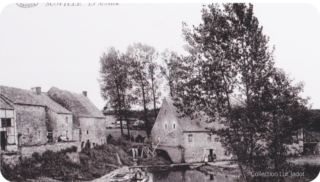
Moulin de Scoville en 1909.

Contemplez le moulin en prenant place à la table pique-nique de l'artiste Norska située le long du Bocq. Jetez également un coup d'oeil au panneau didactique !