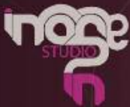
Image in Studio