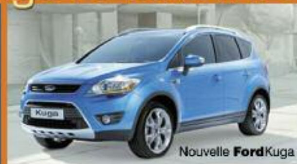
Nouvelle Ford Kuga

Spécialiste Indépendant FORD Spécialiste PEUGEOT - CITROËN Réparation toutes marques Montage pneus + géométrie Vente de véhicules occasions garantis Vente de véhicules neufs